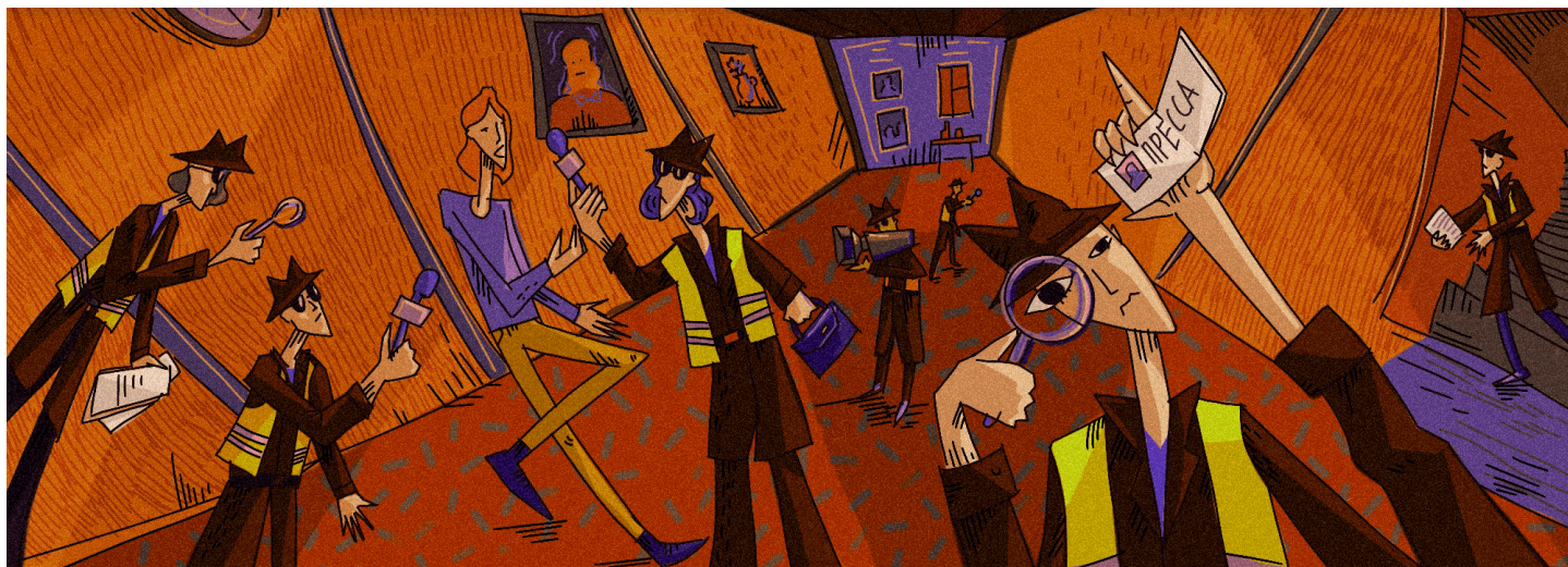
Иллюстрация: Катя Литвинова для ОВД-Инфо